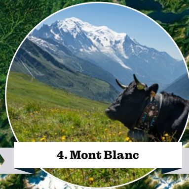
4. Mont Blanc