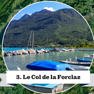
3. Le Col de la Forclaz