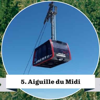
5. Aiguille du Midi