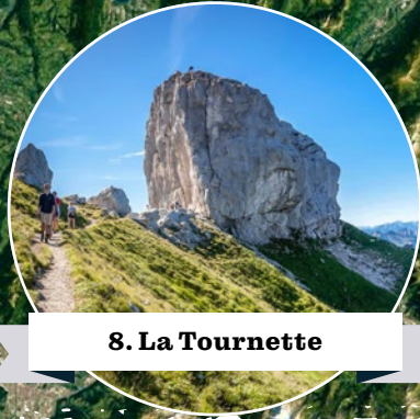
8. La Tournette