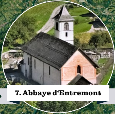
7. Abbaye d'Entremont