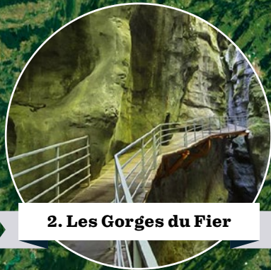
2. Les Gorges du Fier